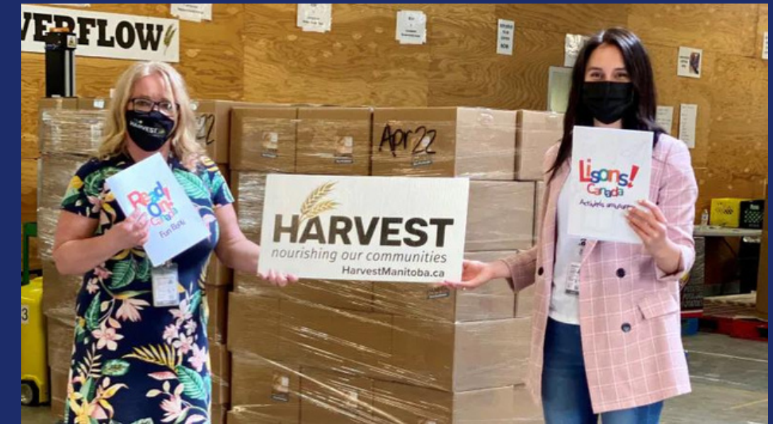
Food banks partnering with literacy groups to distribute books, EatNorth.com