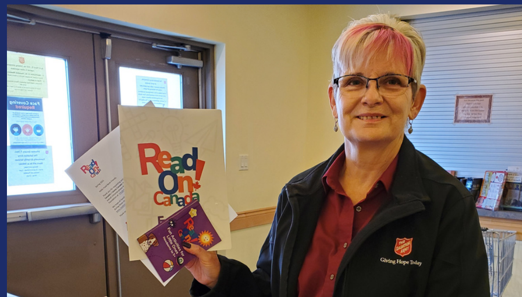
What is one thing we can do about children's learning loss during the pandemic? Put a book in their hands, The Globe and Mail