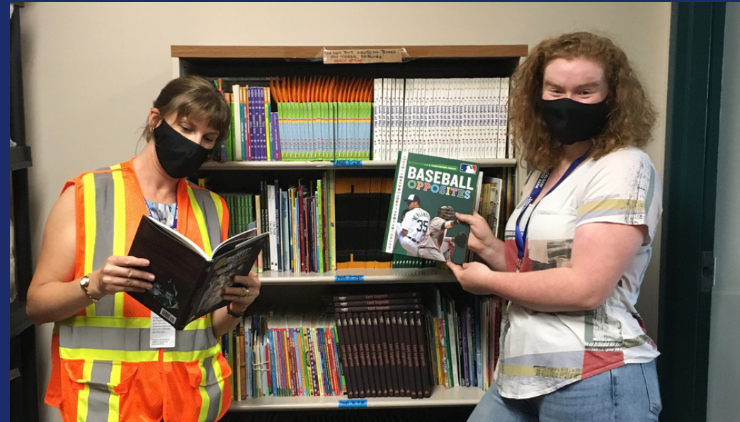
Canadian initiative to donate books to kids during pandemic wins World Literacy Award, CBC