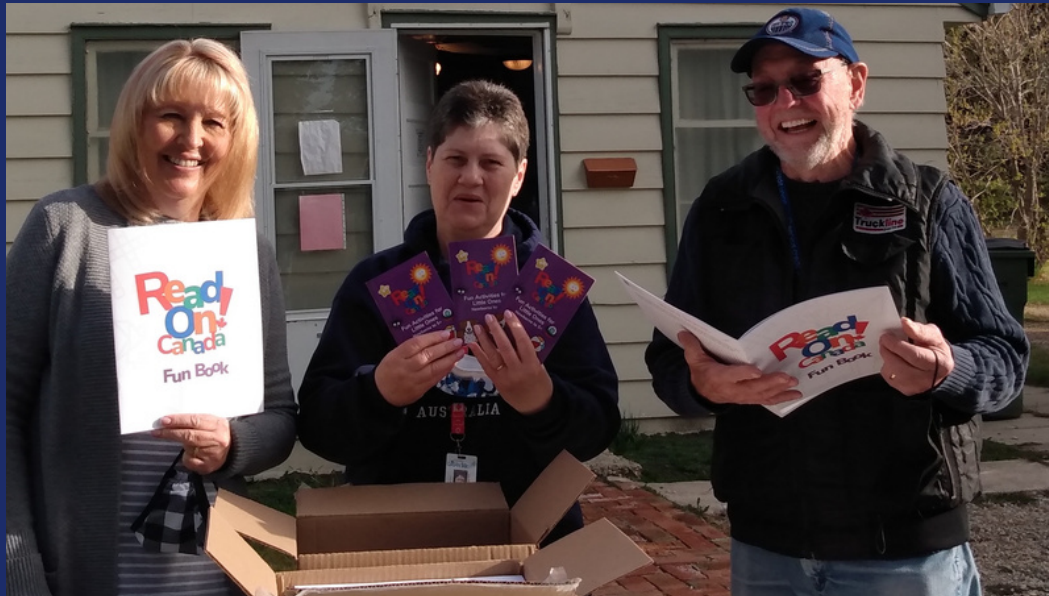
Food banks, literacy groups to distribute 150,000 children's books across Canada this summer, CBC